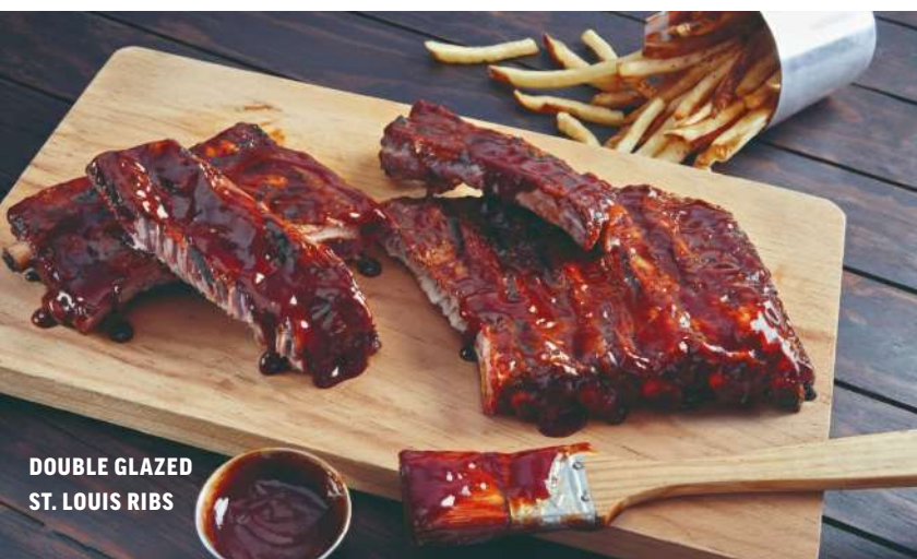
DOUBLE GLAZED ST. LOUIS RIBS

CHILES TOREADOS PREPARADOS (3 pz.) $35 GUACAMOLE (226 g) $79