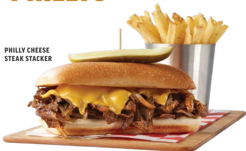
PHILLY CHEESE STEAK STACKER