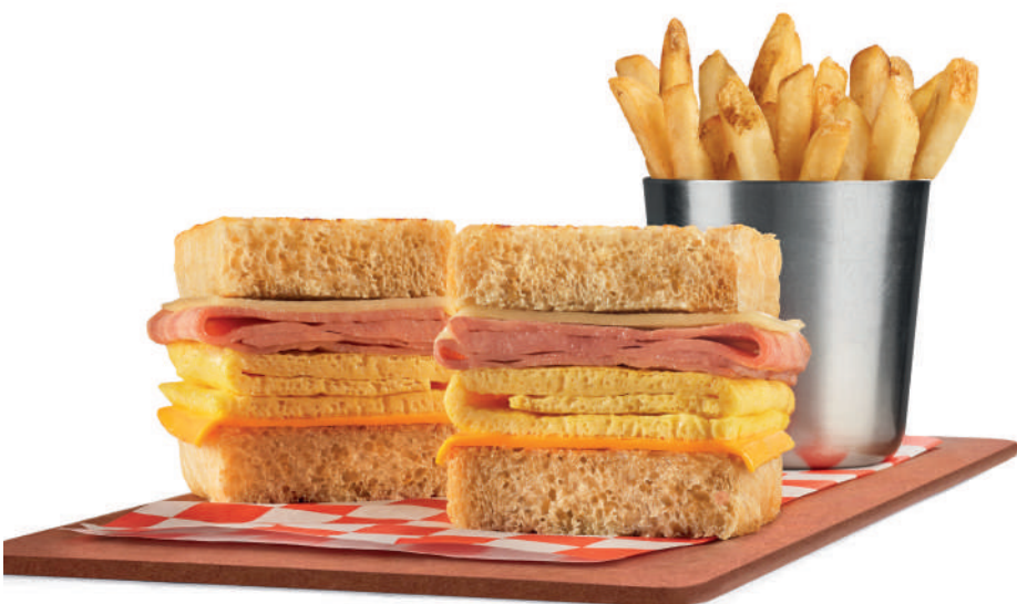
HAM & EGG MELT