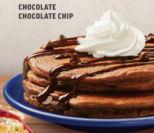
CHOCOLATE CHOCOLATE CHIP