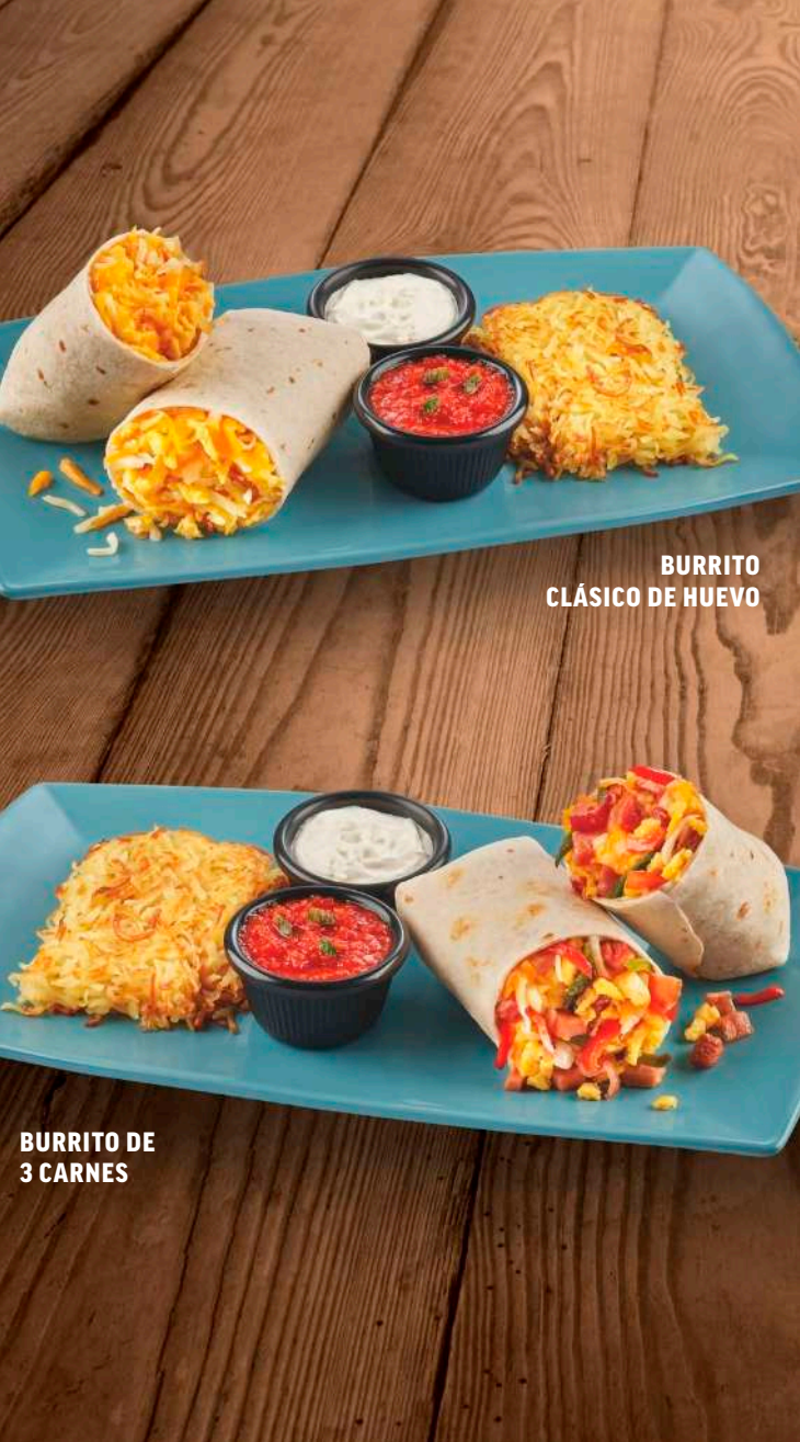
BURRITO CLÁSICO DE HUEVO