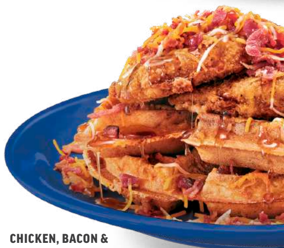
CHICKEN, BACON & CHEDDAR WAFFLE