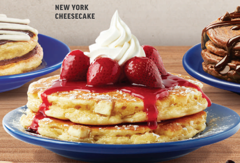
NEW YORK CHEESECAKE