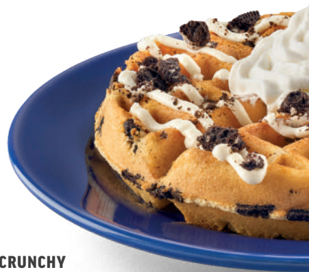
COOKIE CRUNCHY WAFFLE