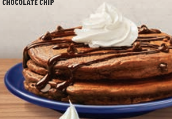
CHOCOLATE CHOCOLATE CHIP