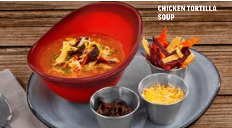
CHICKEN TORTILLA SOUP

QUESADILLA Quesadilla rellena con trocitos de tocino y queso gratinado. Servida con la proteína de tu elección. Acompañada de ensalada de col y papas a la francesa. Pulled pork (113 g) $189 | Pollo (100 g) $175 | Sirloin (113 g) $229