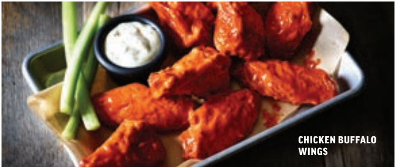
CHICKEN BUFFALO WINGS