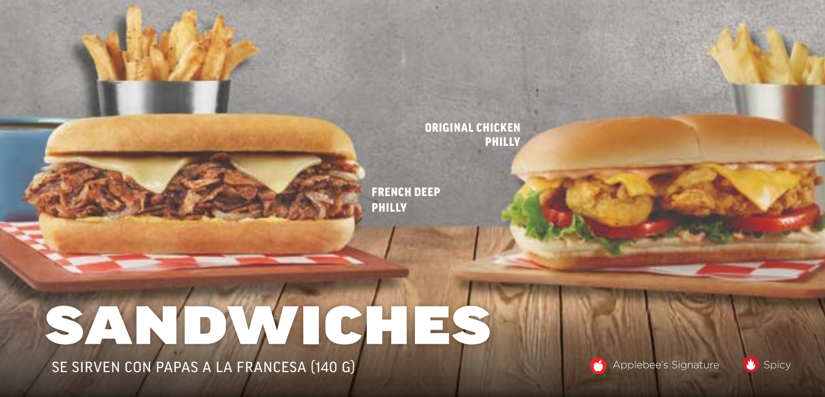
ORIGINAL CHICKEN PHILLY