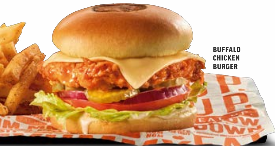
BUFFALO CHICKEN BURGER