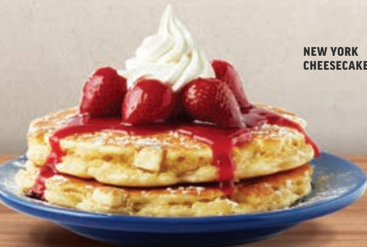
NEW YORK CHEESECAKE