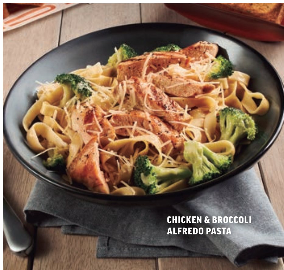
CHICKEN & BROCCOLI ALFREDO PASTA

Exquisita pasta bañada en una cremosa salsa de chipotle con un equilibrio perfecto entre picante y ahumado, mezclada con tocino de cerdo y un toque de queso parmesano. $169 Con pollo (112 g). $189