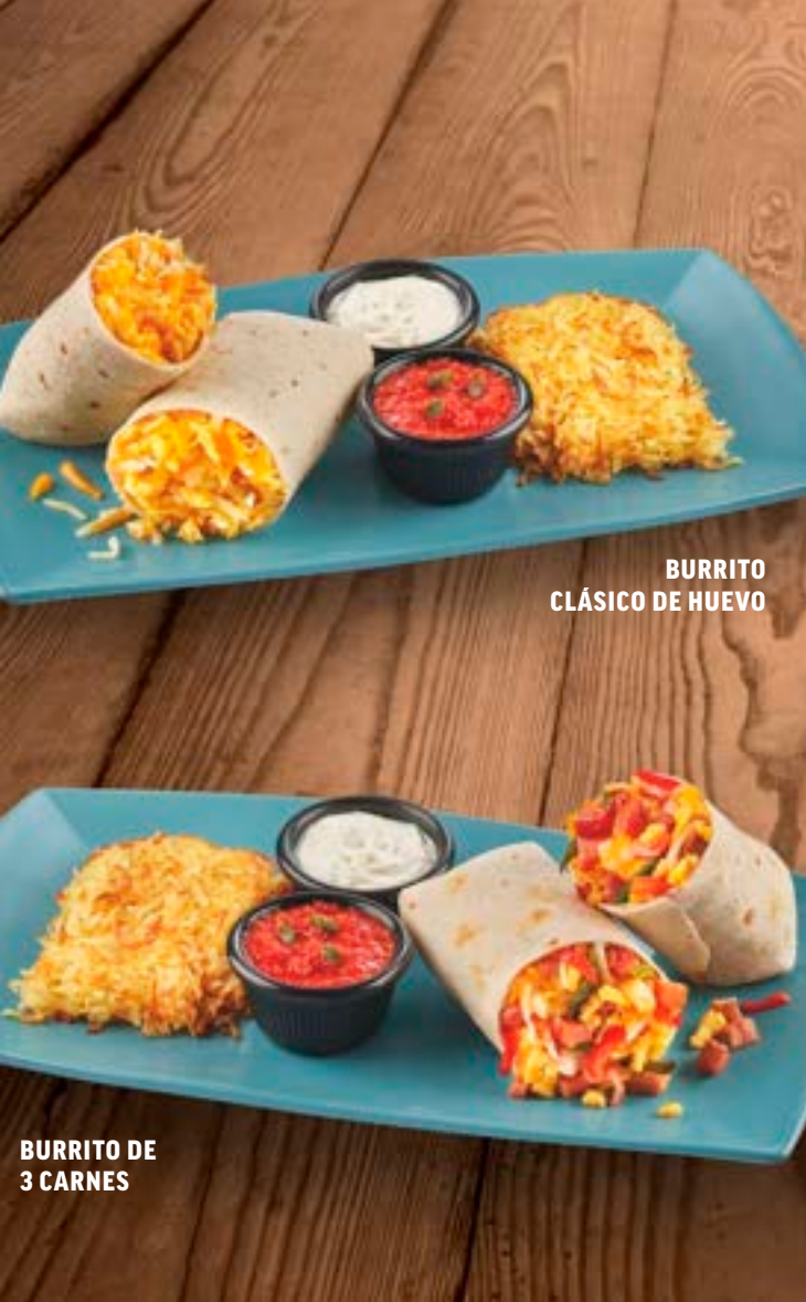
BURRITO CLÁSICO DE HUEVO