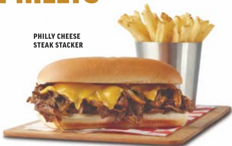
PHILLY CHEESE STEAK STACKER