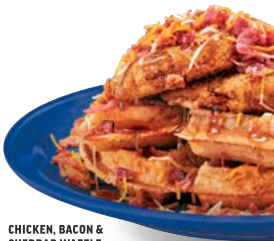
CHICKEN, BACON & CHEDDAR WAFFLE