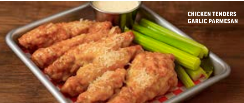
CHICKEN TENDERS GARLIC PARMESAN