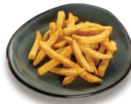
Papas a la francesa (226 g) $69