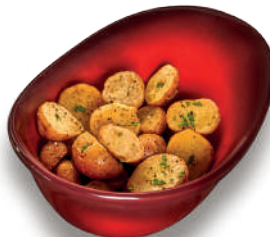
Papa roja sazonada (226 g) $75