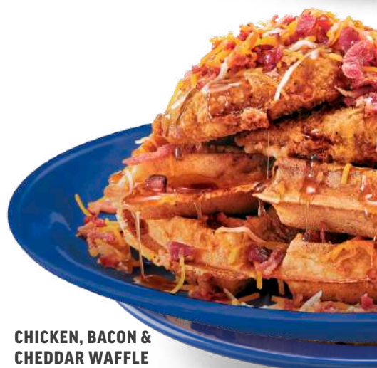
CHICKEN, BACON & CHEDDAR WAFFLE