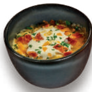
Puré de papa (226 g) $45