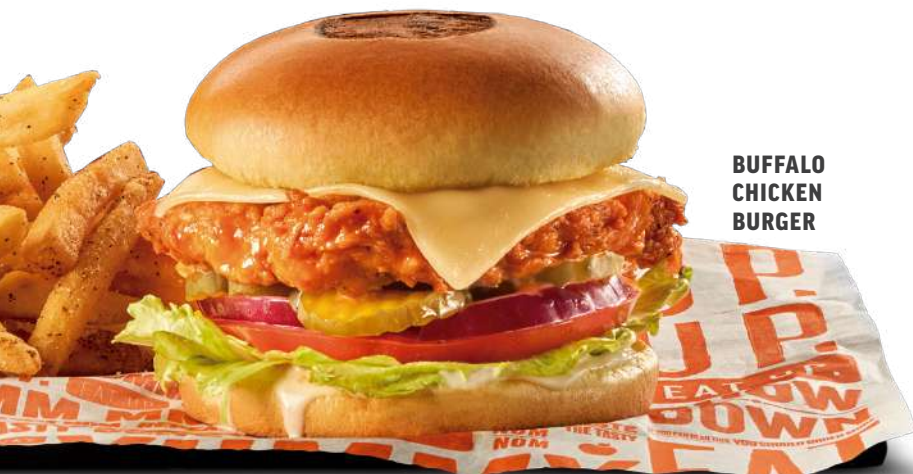
BUFFALO CHICKEN BURGER