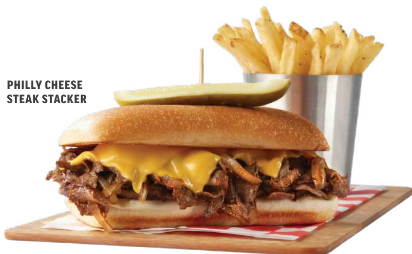
PHILLY CHEESE STEAK STACKER