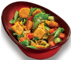
House salad side (1 pz) $55