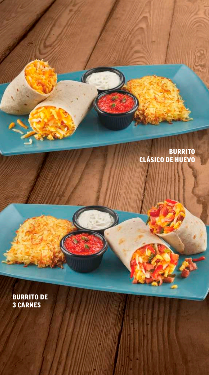
BURRITO CLÁSICO DE HUEVO