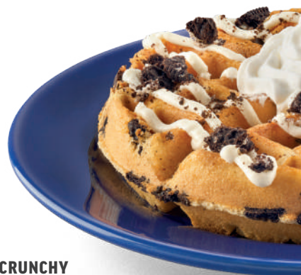
COOKIE CRUNCHY WAFFLE