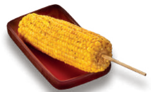
Elote (1 pz) $69