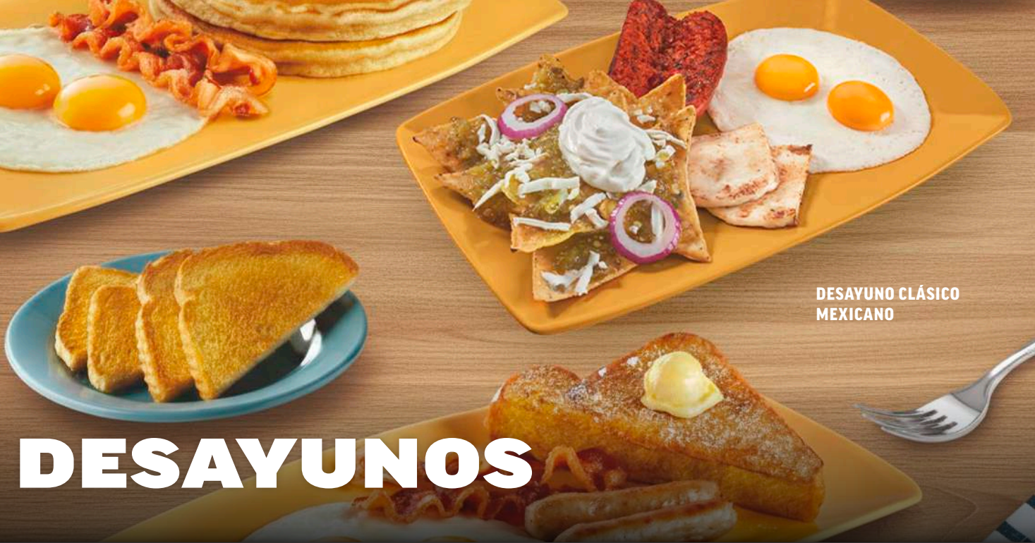
DESAYUNO CLÁSICO MEXICANO