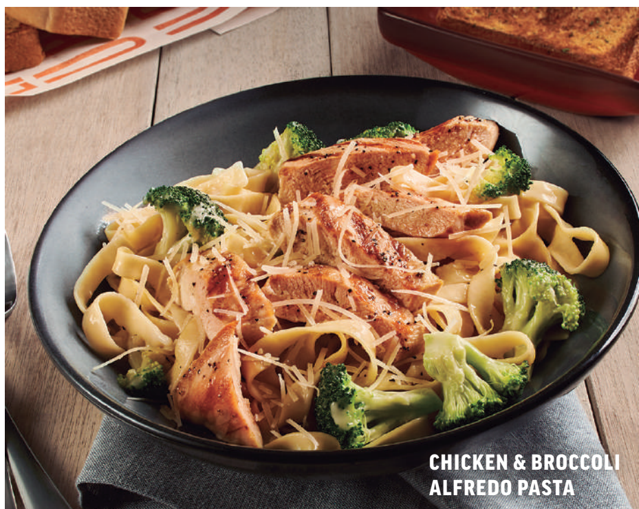
CHICKEN & BROCCOLI ALFREDO PASTA

Deliciosa pasta penne en salsa pomodoro con tocino ligeramente picoso. $249 Con pollo (142 g): $279